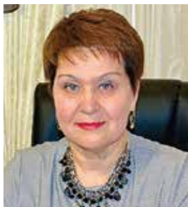
Сария Харисовна САБУРСКАЯ Уполномоченный по правам человека в Республике Татарстан