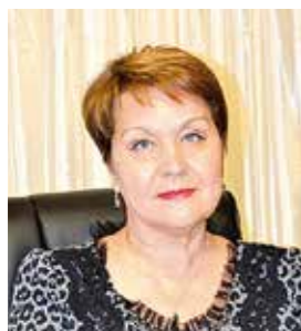
Сария Харисовна САБУРСКАЯ Уполномоченный по правам человека в Республике Татарстан