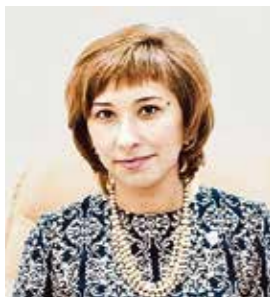
Эльмира Амировна ЗАРИПОВА Министр труда, занятости и социальной защиты Республики Татарстан