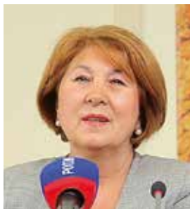
Зиля Рахимьяновна ВАЛЕЕВА Директор ГБУ «Государственный историко-архитектурный и художественный музей-заповедник «Казанский Кремль», председатель Республиканской общественной организации «Женщины Татарстана»