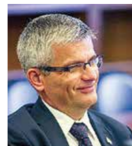
Ришард КОМЕНДА Старший советник по правам человека при системе ООН в Российской Федерации