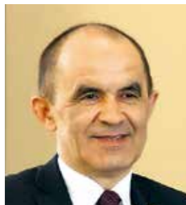
Энгель Навапович ФАТХОВ Заместитель Премьер-министра Республики Татарстан – министр образования и науки Республики Татарстан