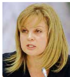
Элла Александровна ПАМФИЛОВА Уполномоченный по правам человека в Российской Федерации