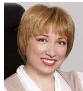
Лариса Юрьевна ГЛУХОВА министр юстиции Республики Татарстан

Лилия РАСЧЕСКОВА, исполнительный директор РОБО РТ «Центр толерантности «Поволжский мир»